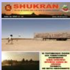
La OJE en el Sahara